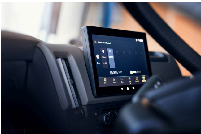
Kørehviletidssupport i sidedisplayet.

* Fås kun til FH, FM og FMX. INFODF eller INFONDF er nødvendig.